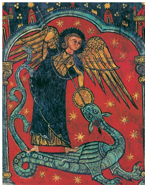
Michael, romanische Malerei, 12. Jh.

Nachfolgend nun die schriftliche Fassung des Vortrages, der von Günther Zwahlen (1930 - 2016) über das Wirken der Asuras 1998 im Paracelsus-Zweig in Basel gehalten und von ihm selber verschriftlicht wurde. 2 Dieses Thema ist derzeit vor allem im Zusammenhang mit der Veröffentlichung der Epstein-Dokumente wesentlich, da nun menschliches Handeln offenbar wird, welches in seiner Dimension der Abgründigkeit kaum fassbar ist. Dies müsste unverständlich bleiben, wenn man das Wirken eines wesenhaften Bösen durch Menschen auch weiterhin ignorieren bzw. leugnen wollte. Man sei sich aber darüber im Klaren, dass es sich bei dem, was aktuell offenbar wird, lediglich um die sprichwörtliche Spitze eines Eisberges handeln dürfte. Dem wird sich nun die Menschheit stellen und aus der herrschenden Apathie und Resignation gegenüber den bestehenden