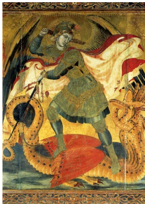
Michael, Ambrogio Lorenzetti

gültig, fahrlässig, gedankenlos, selbstsüchtig. Das ahrimanisch Böse: verlogen und gewissenlos. Das asurisch Böse absichtlich, gewollt, mit Lust. Und eines zieht das Andere nach sich: In dem Moment, wo wir Luzifer aufrufen, stellt sich auch Ahriman ein - und heute im 20. Jahrhundert in seinem Gefolge auch die asurischen Wesen. Ihr Impuls kommt einer gewaltigen Verstärkung, ja einer Übersteigerung des ahrimanisch Bösen gleich. - Und andererseits: In dem Moment, wo wir Ahriman und sein Gefolge aufrufen, stellt sich auch Luzifer ein.