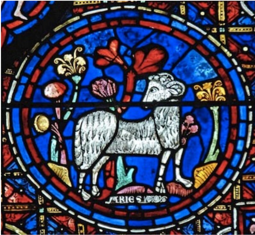
Le bélier : vitrail de la cathédrale de Chartres

Cette contemplation de soi-même que représente le Bélier revêt une importance capitale. Nous devons de nouveau trouver cette sagesse du cosmos et ceci d'une manière pleinement consciente et non par clairvoyance instinctive comme c'était le cas dans l'Antiquité. Il faut que devienne conscient pour nous le fait que les forces de notre tête doivent essentiellement leur développement aux influences du Bélier, du Taureau, des Gémeaux et du Cancer ; que les forces de notre thorax doivent leur développement aux influences des quatre constellations moyennes : Lion, Vierge, Balance et Scorpion . Notre tête doit sa forme au cosmos à travers l'influence des forces du Bélier, du Taureau, des Gémeaux et du Cancer. Ces forces, pour comprendre l'homme du point de vue de sa formation céphalique, nous pouvons les considérer comme rayonnant du haut, cependant que les influences zodiacales agissant sur l'organisation moyenne de l'homme, sur son thorax sont plutôt latérales : Lion, Vierge, Balance et Scorpion.