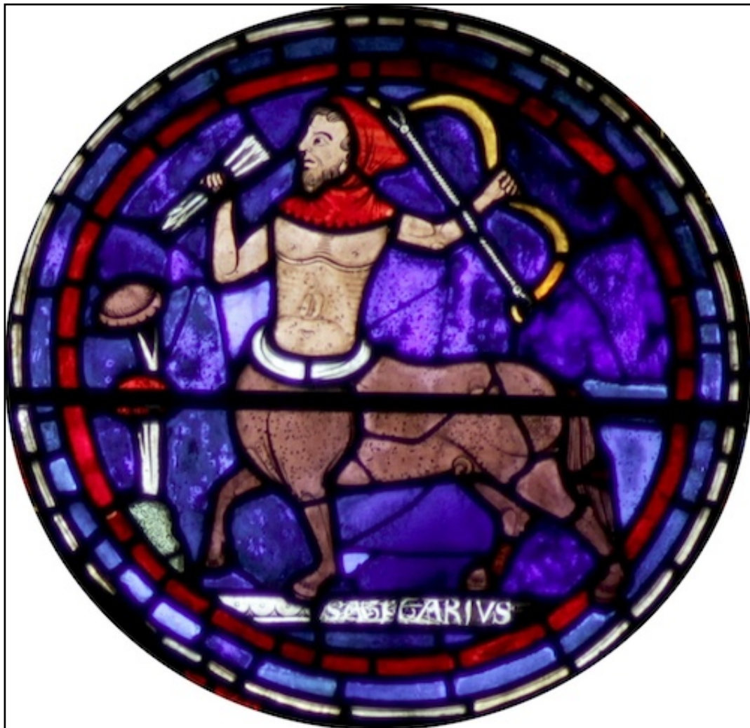
Le sagittaire : vitrail de la cathédrale de Chartres

C'est ainsi que nous ramenons la forme de l'homme au cosmos : son influence s'exprime telle quelle dans la forme sphérique de la tête, l'homme y étant directement exposé aux forces des étoiles fixes, c'est-à-dire à leur représentant, le Zodiaque ; ou bien l'influence étant latérale, cette forme ne s'exprime que d'une manière cachée, masquée dans l'organisation thoracique de l'homme : Lion, Vierge, Balance et Scorpion ; ou encore, n'agissant pas directement sur la forme humaine, cette influence se fait par le biais de l'activité exercée sur terre par l'homme, par son action sur le métier. Et c'est le Sagittaire qui représente le dieu du chasseur, un dieu tellurique et cosmique, un dieu sphérique que les représentations montrent sous les traits d'une sorte de centaure, mi-cheval, mi-homme, mi-animal, mi-humain.