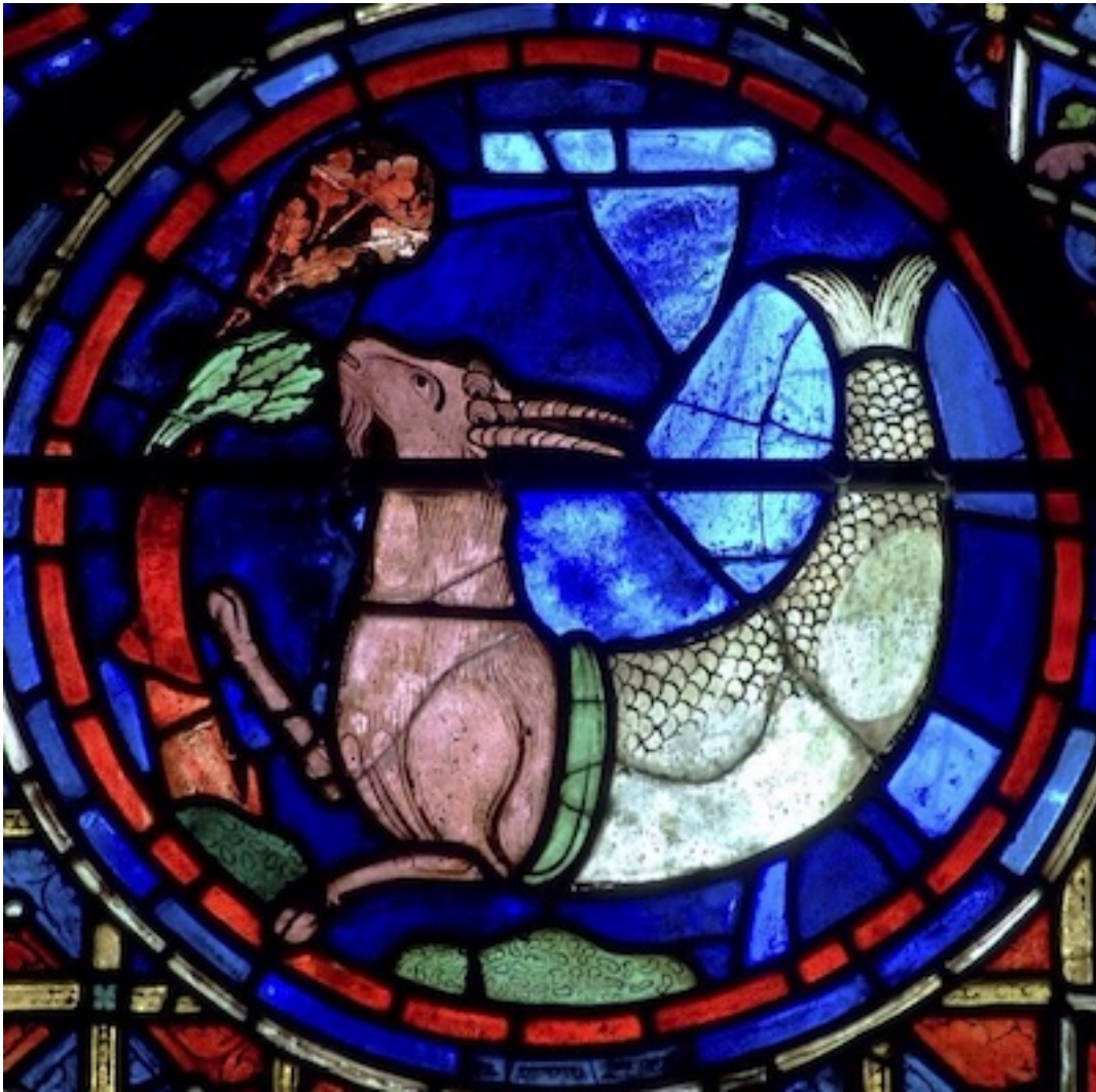
Le capricorne : vitrail de la cathédrale de Chartres

Le troisième aspect est celui du Verseau. Mais regardez un peu l'ancien signe du Verseau ; il ne représente pas quelqu'un qui barbote dans l'eau ; dans la vraie représentation zodiacale, on voit quelqu'un marcher sur la terre ferme, dans un pré ou dans un champ qu'il fume en y versant de l'eau fertilisante. C'est l'homme qui représente le cultivateur, ce troisième métier que l'on pratiquait en ces temps primitifs où l'on avait un savoir instinctif de ces rapports-là : métiers de chasseur, de berger, de cultivateur.