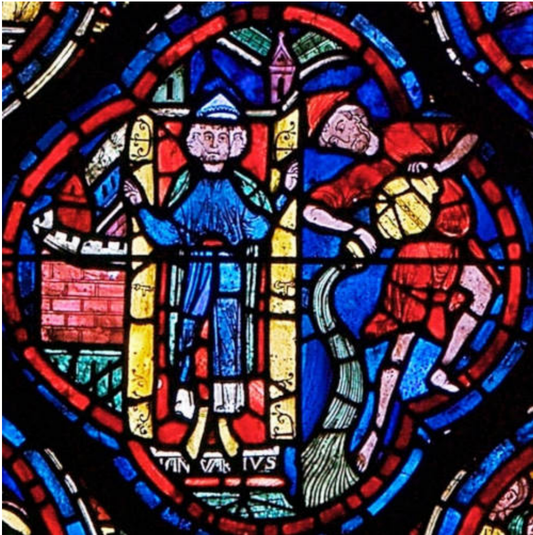
Le verseau : vitrail de la cathédrale de Chartres

Le quatrième métier était celui de batelier. Dans les temps primitifs, les bateaux étaient en forme de poisson. Plus tard encore, on en retrouvera partout les traces dans les têtes de dauphins formant la proue des bateaux. D'où le signe des Poissons, des deux bateaux attachés l'un à l'autre, partant faire du commerce, et représentant ce quatrième métier ayant rapport avec les membres de l'homme. le métier. de commerçant, de marchand.