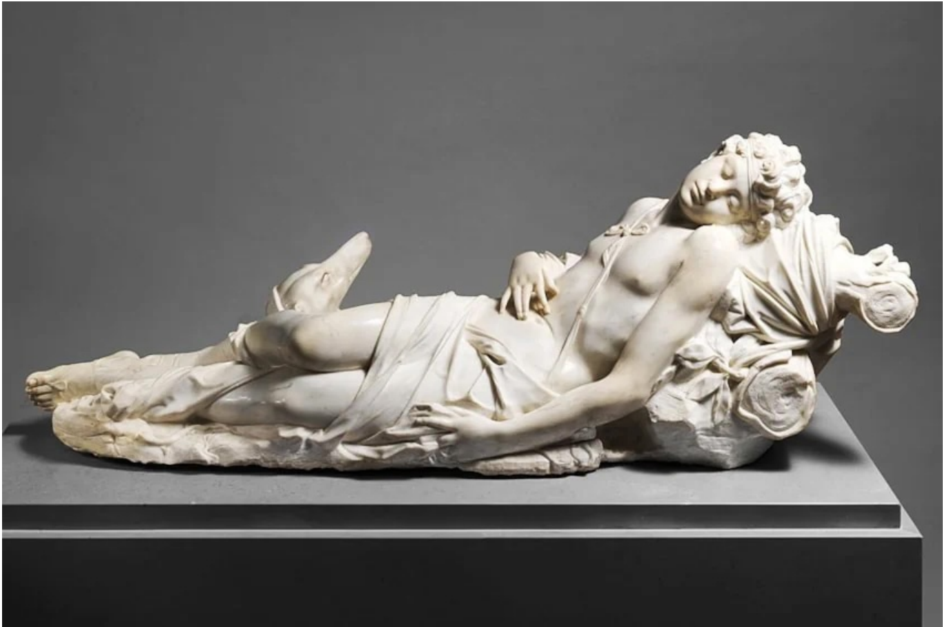
La mort du Dieu grec Adonis - Une sculpture d'Antonio Corradini (c. 1723-1725)

Première conférence de la PARTIE II du recueil de conférences :