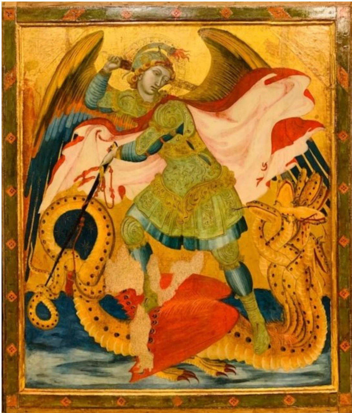
Michael, peinture d'Ambrogio Lorenzetti